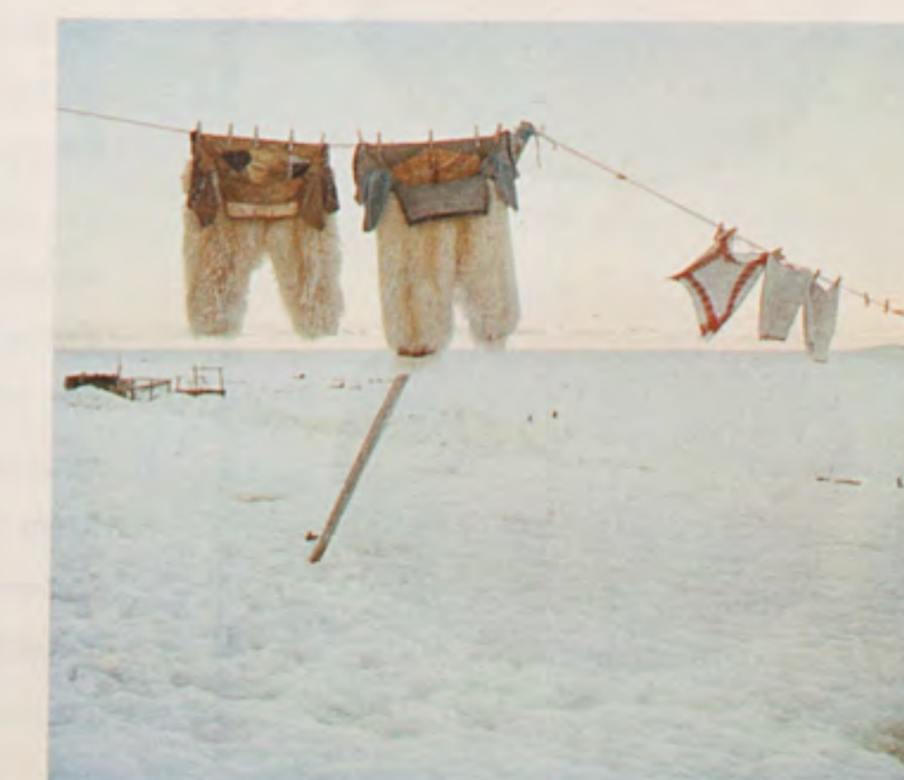
▼ Deux pantalons en peau d'ours et trois serviettes, 2002.